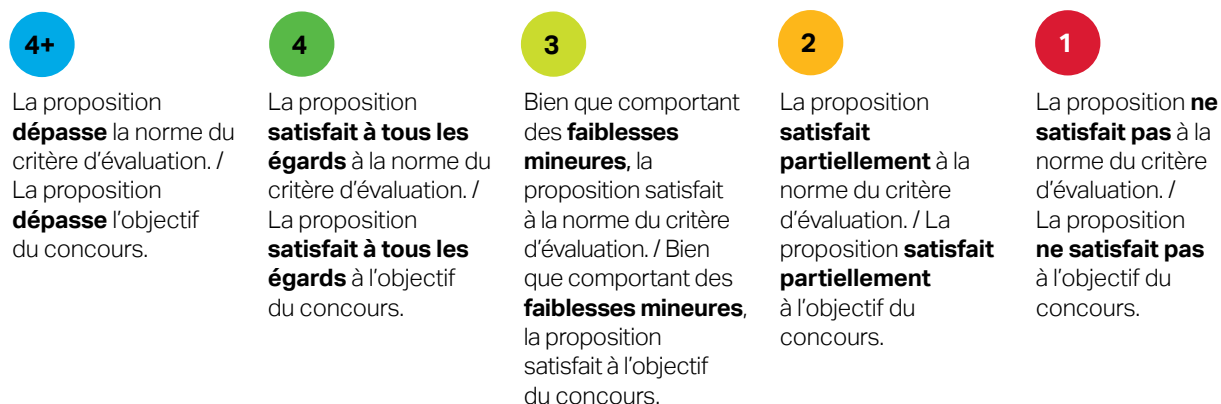
Figure 2 : Échelle d'évaluation de la FCI

Nous avons recours à une échelle d'évaluation comprenant cinq cotes permettant de déterminer dans quelle mesure une proposition répond à chaque critère d'évaluation ou objectif du concours.